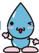
「すずかの水道」キャラクター すいてきくん