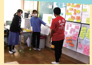
▲ワークショップの結果を 発表する子どもたち