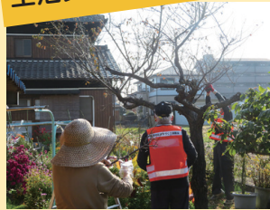
▲庭木の剪定をお手伝い

高齢のため、庭木の手入れや、ごみ出しなどが困難になった方を有償で手伝う「幸ネット」。それぞれの自治会が要支援者の依頼を取りまとめ、身近な人たち同士で助け合うことで、安心して暮らせるまちづくりにつなげています。