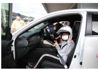
▲プロドライバーによる講演 ▲助手席に乗って出発