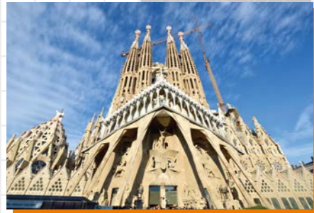
▲スペインGP(バルセロナ)