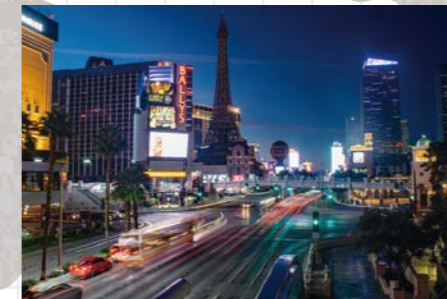
▲ラスベガスGP(ラスベガス)