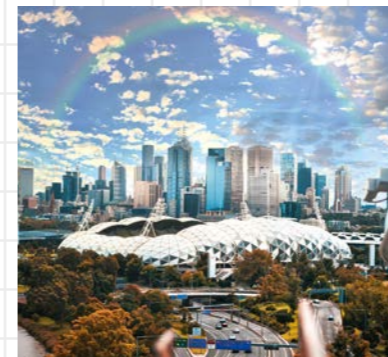
▲オーストラリアGP(メルボルン)