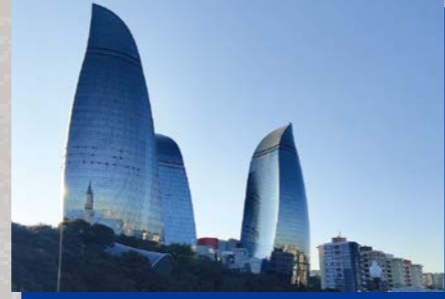
▲アゼルバイジャンGP(バクー)