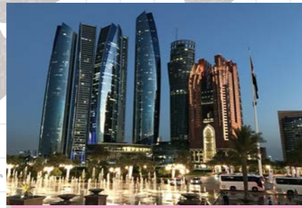
▲アブダビGP(アブダビ)