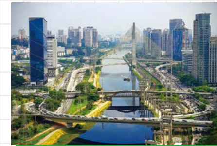
▲ブラジルGP(サンパウロ)

マイアミGP(アメリカ) カナダGP アメリカGP メキシコGP ラスベガスGP(アメリカ)