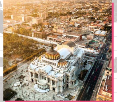
▲メキシコGP(メキシコシティ)