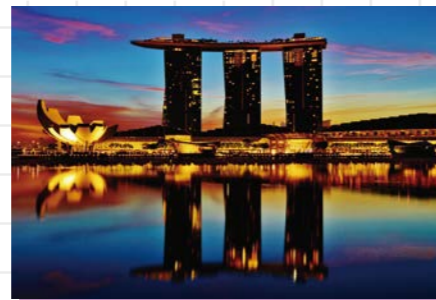
▲シンガポールGP(シンガポール)