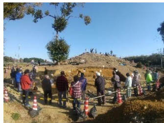
富士山1号墳現地公開