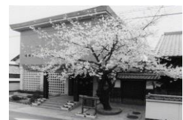
佐佐木信綱記念館