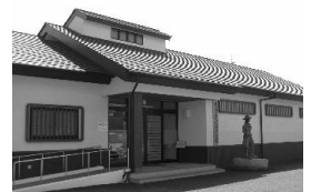
大黒屋光太夫記念館

所在地 鈴鹿市若松中一丁目 1 番 8 号 TEL059(385)3797 展示品 光太夫関係資料 (古文書, 絵画, 墨跡等) 活 動 企画展, 特別展 休館日 月曜・火曜日(ただし, 月曜日のみ祝日の場合は 開館), 第 3 水曜日, 年末年始 入館者 2,374 人 (令和 4 年度)