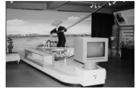
前川定五郎資料室

所在地 鈴鹿市岡田一丁目 29 番 1 号 牧田小学校内 展示品 前川定五郎遺愛品, 表彰状等 公開日 予約制 [文化財課 TEL059(382)9031] 入館者 59 人 (令和 4 年度)