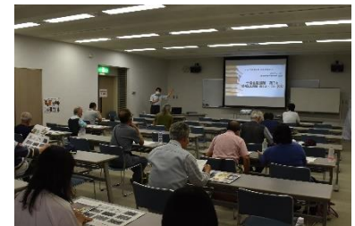
第1回スライド説明会