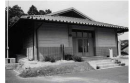
鈴鹿市稲生民俗資料館

所在地 鈴鹿市稲生西二丁目 24 番 18 号 伊奈富神社境内地 TEL059(386)4198 展示品 農業関係民俗資料, 稲生地区文書 活 動 常設展 休館日 月曜・火曜日(ただし, 月曜日のみ祝日の場合は 開館), 第 3 水曜日, 年末年始 入館者 1,789 人 (令和 4 年度)