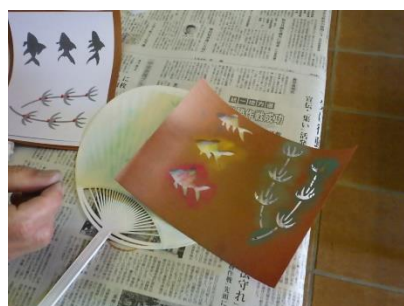
伊勢型紙でうちわづくり体験