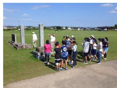
博物館見学(小学生)