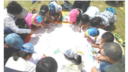
キラキラこども村

土曜日に、障がいのあるなしや国籍にかかわらず、多様な子どもたちが、遊びや創作活動を通して交流する。その中で、仲間とつながることの喜びを感じながら、「共に生きること」について体験を通して学ぶ。