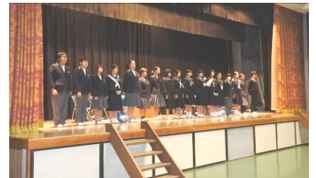
中学生子どもの人権ネットワーク

市内の中学生が人権について考えたり、話し合ったりする。その内容や成果を学校へ発信し、人権を大切にする行動に結びつくようにしている。また、鈴鹿市と亀山市の生徒が参加する生徒会研修会で子どもたちが人権劇やネットワークの取組を発表する。