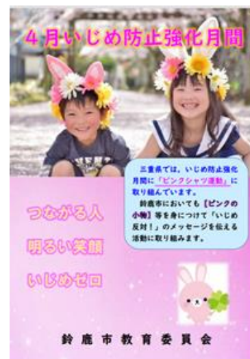
いじめ防止強化月間の チラシ配布