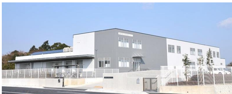
鈴鹿市第二学校給食センター