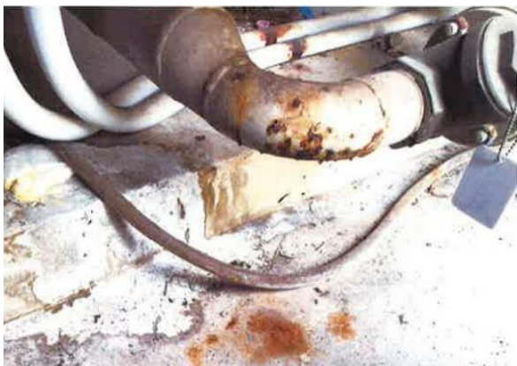
配管腐食による漏水