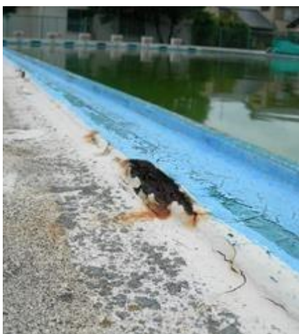
鉄製プール水槽腐食