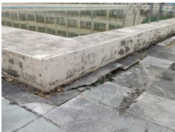
プールサイド床剥離