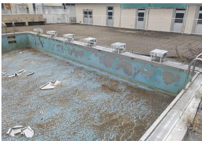
ステンレスプール水槽の防水剥離