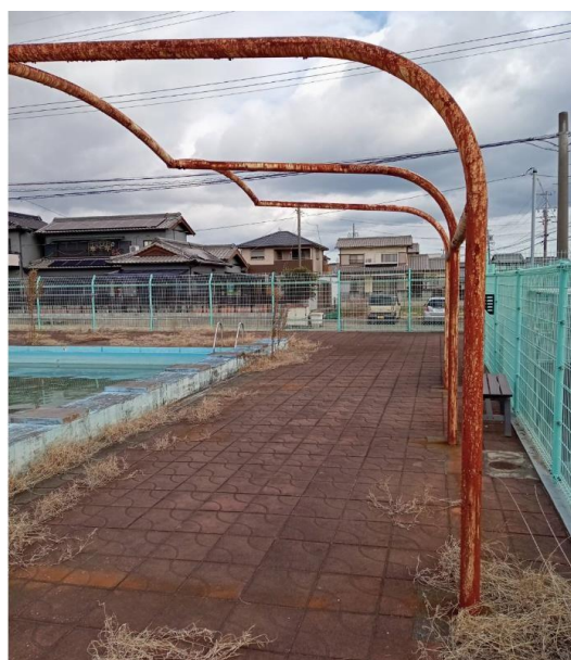
プールサイドテント腐食