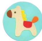
今月のせんせい ハピールーム 保育士

ママの膝に座らせて、スキンシップをとりながら自分自身の爪を切る時と同じように切るとスムーズに切りやすいです。それも嫌がるようなら、子どもがしっかりと寝入ったのを確認してから切るのがコツですね。ベビーカーや車での外出時に寝てしまった際にも爪切りのチャンスです。バッグに子ども用爪切りを常備しておくのも一案です。子どもが動いてどうしても切るのが難しい場合は、爪やすりタイプを使ってみるのも良いですね。