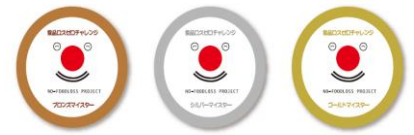
メダル風クリップマグネット

このような取組等とおし、本市では、家庭における食品ロス削減を推進し、個人のライフスタイルを転換し、カーボンニュートラル社会の実現を目指しています。