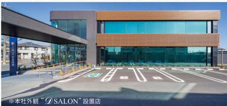
※本社外観 "Dsalon" 設置店