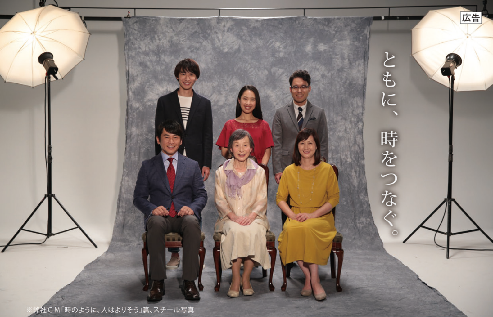
※弊社CM「時のように、人はよりそう」篇、スチール写真