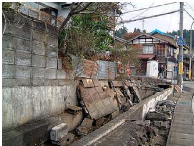
▲倒壊したブロック塀