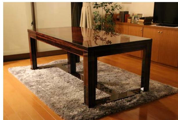
費用：30万円程度(送料・設置費等含)