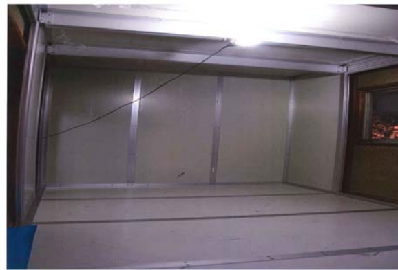
費用：97万円程度～(諸経費込み)