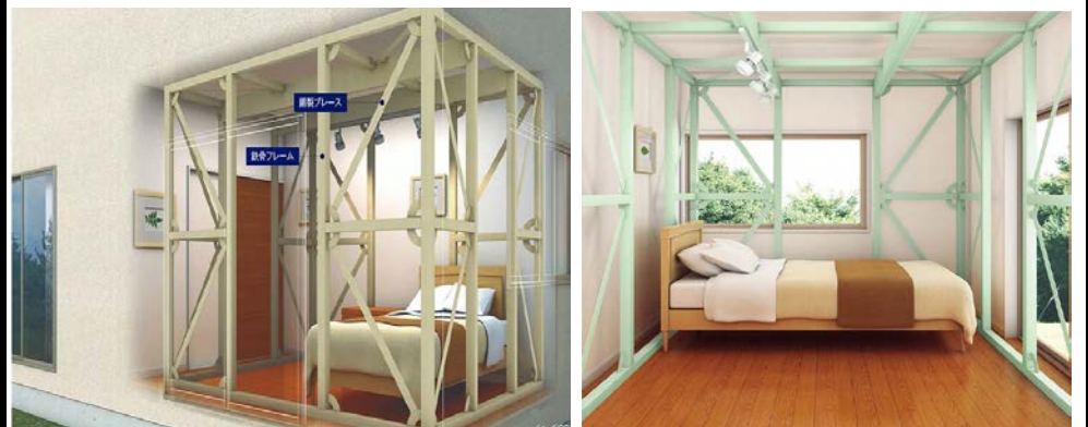
費用：89万円程度～(運搬、設置費用込み)