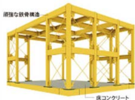
費用：メーカーにお問い合わせください