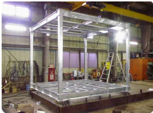
費用：メーカーにお問い合わせください