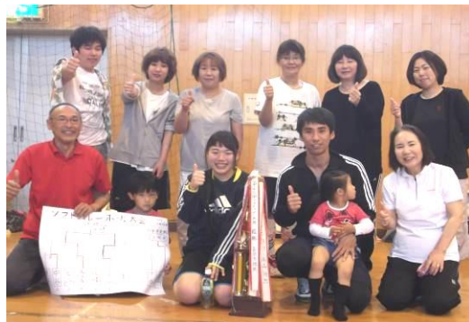
長法寺チーム 優勝おめでとうございます。