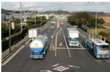
Estrada Nacional 1 ( gosen ) (dentro do bairro de shono )

Estradas administradas pela província de Mie : estrada nacional 306