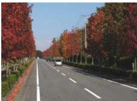
Estrada Municipal Misono 159 (dentro do bairro de misono )