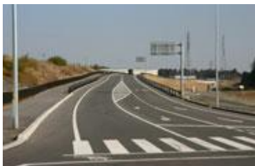
Estrada Nacional 23 ( gosen chusei bypass ) (dentro do bairro de misono )