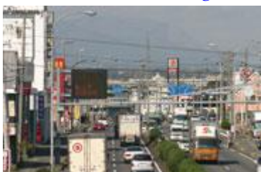
Estrada Nacional 23 ( gosen ) (dentro do bairro de minamitamagaki )