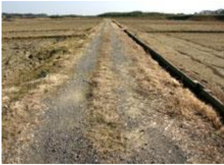
Estradas determinadas pela lei de melhoramento do solo próprias para agricultura (dentro do bairro de ueno )