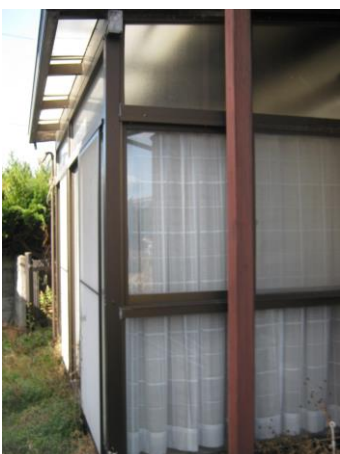
【サニールーム (外観)】