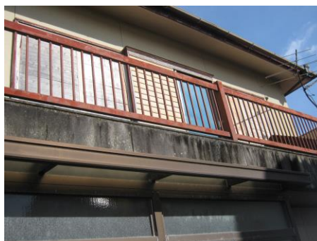
【バルコニー (下から)】