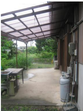
【物干し兼カーポート】