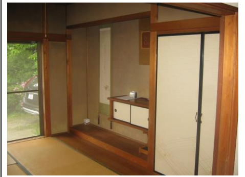
【和室 (6.0 畳)】