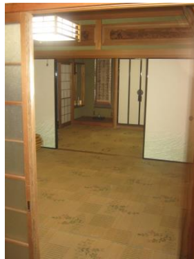
【和室 (8.0 畳)】