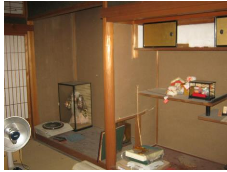
【1階和室 (6.0畳) ②】