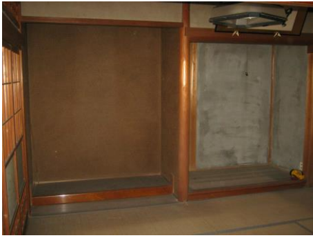
【1階和室 (6.0畳) ①】