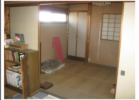
【2階和室 (6.0畳) ②】