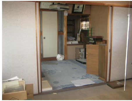
【2階和室 (6.0畳) ①】