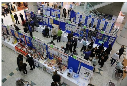
▲過去の企業展示会の様子

主な内容 ○ 企業展示会 自社の「強み」を広く発信することで、鈴鹿のものづくりの「魅力」をアピールします。25社募集予定