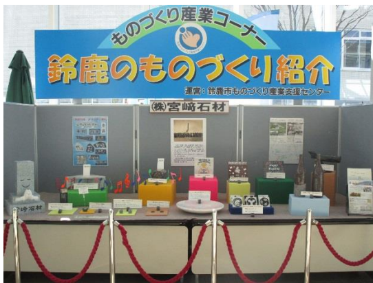
▲ロビー展示の様子

宮崎石材はデザインから加工・販売まで行っている操業百余年の石材加工会社です。社長は高校を卒業後、当社に就職し、石材加工の技術を磨いてきました。先代社長が亡くなったことを契機に3年前から社長業を引き継ぐことになりました。右も左も分からないまま社長になり、社員と力を合わせて会社を運営してきたと話してくれました。先代社長から「他社とは違うことをやるように」と教えられていたため、石で作ったスピーカー、スマホスタンド、ワインボトル等社長自らデザインをし、自社で加工しています。