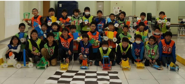
◀鈴鹿少年少女発明クラブによるすずか輪ゴムグランプリの様子

このうちすずか輪ゴムグランプリでは、鈴鹿少年少女発明クラブのクラブ員29人が活動のカリキュラムの中で製作した自作の車を持ち寄り成果発表として出走し、大いに盛り上がりを見せました。