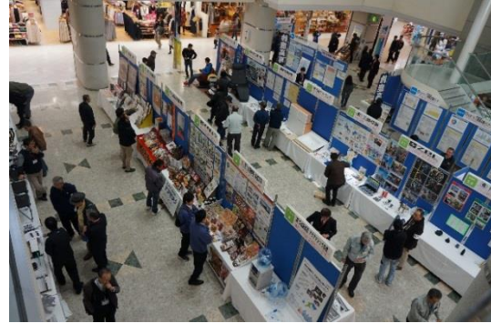
▲企業展示場の様子

今後の産業振興に向け、市内の産業基盤を支えるものづくり製造企業同士の交流や親睦を深め、併せて産業支援機関との連携を促進する場の提供をめざし、1月21日（日）鈴鹿ハンターにて、「鈴鹿市ものづくり企業交流会」を開催しました。交流会では、市内製造企業26社やものづくり産業支援センターの連携5機関による展示会、第5回すずか輪ゴムグランプリ、センターの事業紹介、燃料電池自動車「クラリティ フューエル セル」の展示、鈴鹿高専によるリニアモーターカーの模型展示など、ものづくりに関する多彩な催し物が行われ、2,500人を超える来場がありました。