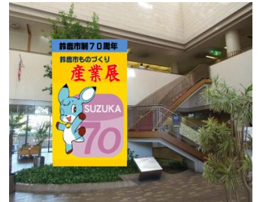
ロビー イメージ写真