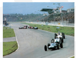
第2回日本グランプリ(1964年)フォーミュラカーレース

間もなく開催される開幕戦「鈴鹿2&4レース」。今年も“聖地”鈴鹿に、国内最高峰フォーミュラカーのエンジン音が、高らかに響き渡ります。