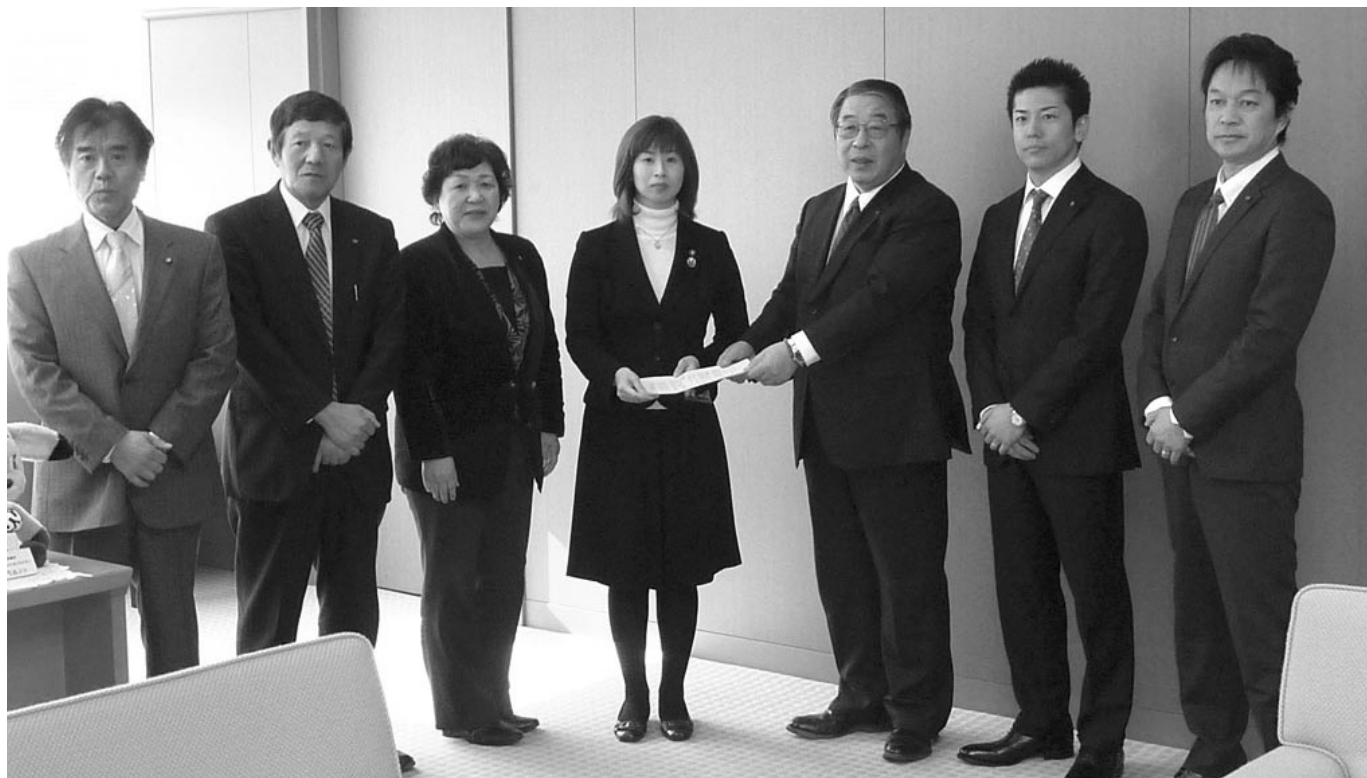
市長に提言書を手渡す正副議長と各常任委員長

三重県鈴鹿市神戸一丁目18番18号 TEL.059-382-7600 http://www.city.suzuka.lg.jp/gikai