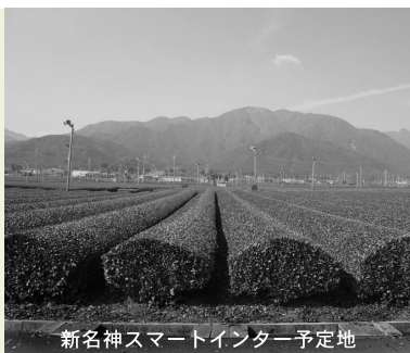
新名神スマートインター予定地

質問1 平成30年度に開通が予定されている新名神高速道路に付随した(仮称)鈴鹿パーキングエリアに設置される、スマートインターの活用をどのように考えているのか。積極的に地域の意見を取り込んでほしい。