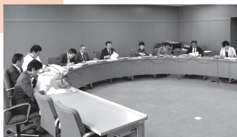
特別委員会審議状況

10月28日に茨城県日立市に、同月29日には静岡県沼津市にそれぞれ「議会改革の状況及び議員定数の見直しについて」を視察テーマとして行政視察を行いました。