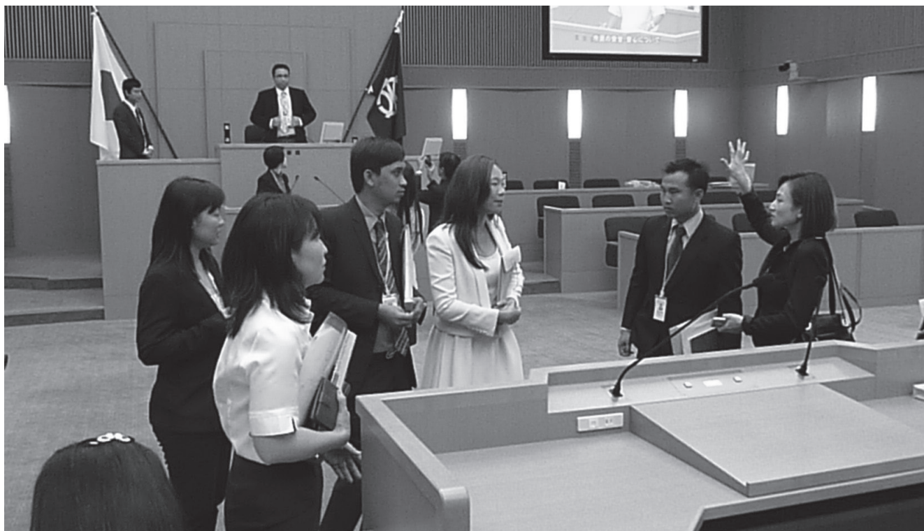
10月2日 議場を見学するIATSSフォーラム(国際交通安全学会)の研修生

■発行/鈴鹿市議会 ■編集/鈴鹿市議会議会だより編集会議 三重県鈴鹿市神戸一丁目18番18号 TEL:059-382-7600 http://www.city.suzuka.lg.jp/gikai/