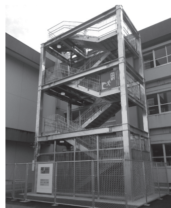
鼓ヶ浦小学校 避難階段

8月19日の委員会で、さらにこの3項目について議論し、10月28日に神奈川県小田原市へ「災害用指定井戸制度」と「災害ボランティアセンターの運営」について、また、同月29日には静岡県富士市へ「津波避難タワー」について、行政視察を行いました。