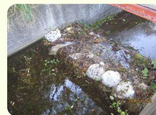
土のうによる洪水吐のかさ上げ

地震により発生した堤防の亀裂に浸水し、2～3日後に堤防が決壊する危険性があることが、過去の震災調査で判明しています。このため地震発生後、安全を確保した上でため池の水位を2m程度下げてください。また、天気予報により大雨が予想される場合についても、営農に支障のない範囲で水位を下げてください。