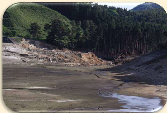
平成22年3月11日、東日本大震災により決壊した藤沼ダム(1,504千m3)

ため池は全国におよそ21万箇所あり、古くから農業用水の貯水池として利用されてきましたが、その多くは築造から100年以上が経過し、老朽化が進行しています。さらに、近年多発している局地的な大雨や地震などの自然災害が重なることにより、ため池が決壊し、人命や財産などに大きな被害をもたらす危険性が高まります。