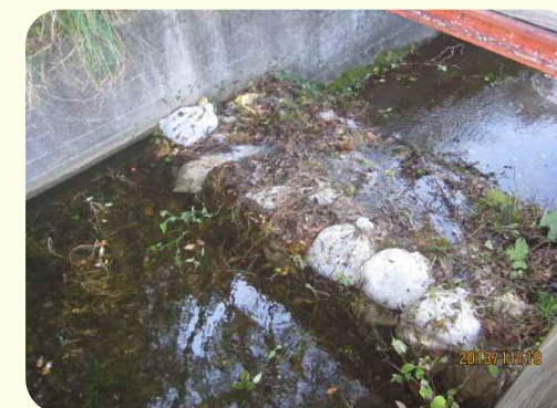
土のうによる洪水吐のかさ上げ

地震により発生した堤防の亀裂に浸水し、2～3日後に堤防が決壊する危険性があることが、過去の震災調査で判明しています。このため地震発生後、安全を確保した上でため池の水位を2m程度下げてください。また、天気予報により大雨が予想される場合についても、営農に支障のない範囲で水位を下げてください。