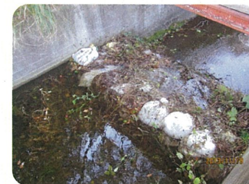
土のうによる洪水吐のかさ上げ

地震により発生した堤防の亀裂に浸水し、2～3日後に堤防が決壊する危険性があることが、過去の震災調査で判明しています。このため地震発生後、安全を確保した上でため池の水位を2m程度下げてください。また、天気予報により大雨が予想される場合についても、営農に支障のない範囲で水位を下げてください。