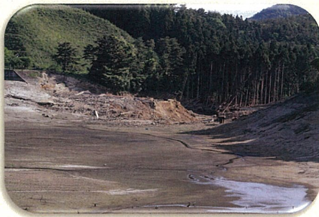
平成23年3月11日、東日本大震災により決壊した藤沼ダム(1,504千m3)

ため池は全国におよそ21万箇所あり、古くから農業用水の貯水池として利用されてきましたが、その多くは築造から100年以上が経過し、老朽化が進行しています。さらに、近年多発している局地的な大雨や地震などの自然災害が重なることにより、ため池が決壊し、人命や財産などに大きな被害をもたらす危険性が高まります。