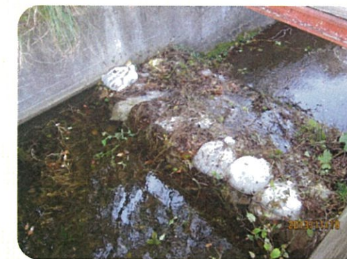
土のうによる洪水吐のかさ上げ

地震により発生した堤防の亀裂に浸水し、2～3日後に堤防が決壊する危険性があることが、過去の震災調査で判明しています。このため地震発生後、安全を確保した上でため池の水位を2m程度下げてください。また、天気予報により大雨が予想される場合についても、営農に支障のない範囲で水位を下げてください。