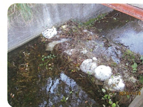
土のうによる洪水吐のかき上げ

地震により発生した堤防の亀裂に浸水し、2~3日後に堤防が決壊する危険性があることが、過去の震災調査で判明しています。このため地震発生後、安全を確保した上でため池の水位を2m程度下げてください。また、天気予報により大雨が予想される場合についても、営農に支障のない範囲で水位を下げてください。