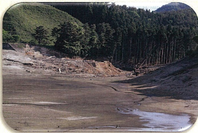
平成23年3月11日、東日本大震災により決壊した藤沼ダム(1,504千m 3 )

ため池は全国におよそ21万箇所あり、古くから農業用水の貯水池として利用されてきましたが、その多くは築造から100年以上が経過し、老朽化が進行しています。さらに、近年多発している局地的な大雨や地震などの自然災害が重なることにより、ため池が決壊し、人命や財産などに大きな被害をもたらす危険性が高まります。