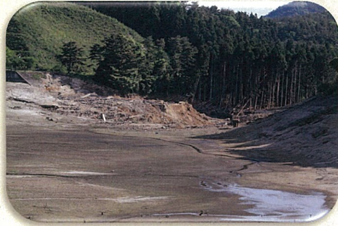
平成23年3月11日、東日本大震災により決壊した藤沼ダム(1,504千m3)

ため池は全国におよそ21万箇所あり、古くから農業用水の貯水池として利用されてきましたが、その多くは築造から100年以上が経過し、老朽化が進行しています。さらに、近年多発している局地的な大雨や地震などの自然災害が重なることにより、ため池が決壊し、人命や財産などに大きな被害をもたらす危険性が高まります。