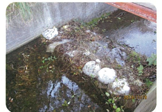
土のうによる洪水吐のかさ上げ

地震により発生した堤防の亀裂に浸水し、2～3日後に堤防が決壊する危険性があることが、過去の震災調査で判明しています。このため地震発生後、安全を確保した上でため池の水位を2m程度下げてください。また、天気予報により大雨が予想される場合についても、営農に支障のない範囲で水位を下げてください。