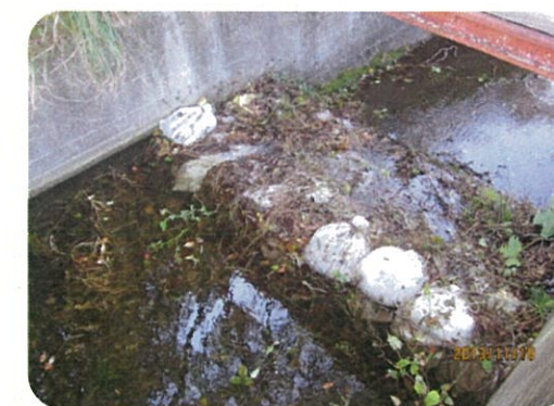
土のうによる洪水吐のかさ上げ

地震により発生した堤防の亀裂に浸水し、2～3日後に堤防が決壊する危険性があることが、過去の震災調査で判明しています。このため地震発生後、安全を確保した上でため池の水位を2m程度下げてください。また、天気予報により大雨が予想される場合についても、営農に支障のない範囲で水位を下げてください。