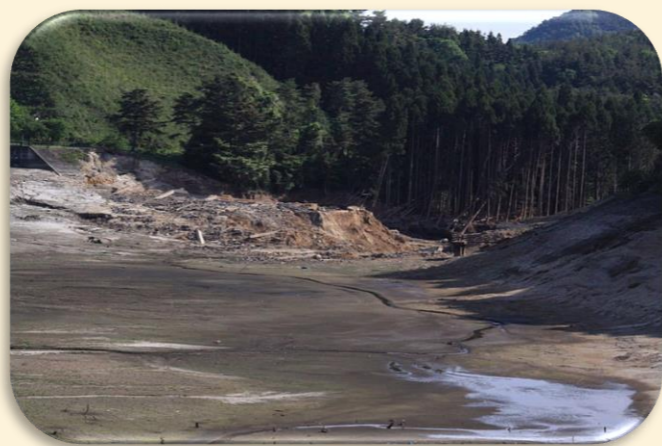
平成23年3月11日、東日本大震災により決壊した藤沼ダム(1,504千m3)

ため池は全国におよそ21万箇所あり、古くから農業用水の貯水池として利用されてきましたが、その多くは築造から100年以上が経過し、老朽化が進行しています。さらに、近年多発している局地的な大雨や地震などの自然災害が重なることにより、ため池が決壊し、人命や財産などに大きな被害をもたらす危険性が高まります。