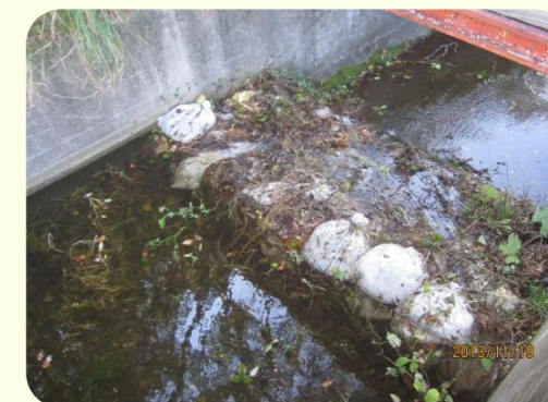
土のうによる洪水吐のかさ上げ

地震により発生した堤防の亀裂に浸水し、2～3日後に堤防が決壊する危険性があることが、過去の震災調査で判明しています。このため地震発生後、安全を確保した上でため池の水位を2m程度下げてください。また、天気予報により大雨が予想される場合についても、営農に支障のない範囲で水位を下げてください。