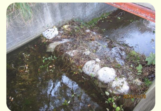
土のうによる洪水吐のかさ上げ

地震により発生した堤防の亀裂に浸水し、2～3日後に堤防が決壊する危険性があることが、過去の震災調査で判明しています。このため地震発生後、安全を確保した上でため池の水位を2m程度下げてください。また、天気予報により大雨が予想される場合についても、営農に支障のない範囲で水位を下げてください。